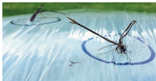
Aaskrähen picken Löcher in die Stretchfolie und ziehen gerne Grashalme heraus.

Am Beispiel des Praxisversuchs auf dem Standort Puch bei Paldau zum ersten Aufwuchs wird bei der Erhebung des Schadausmaßes der Unterschied zwischen den beiden Stretchfolien und der Lage der Ballengruppen auf der Versuchsfläche ersichtlich (Abb. 2). Im Durchschnitt beider Ballengruppen konnte eine Reduktion der Krallenschäden und Picklöcher festgestellt werden. Der Vogelkot auf den Ballen dient als Indikator, dass sich Krähen auf den Ballen aufhielten. Herausgezogene Grashalme sind ein Beweis für die Picklöcher durch Aaskrähen, andere kleine Löcher wurden als Krallenschäden bewertet.